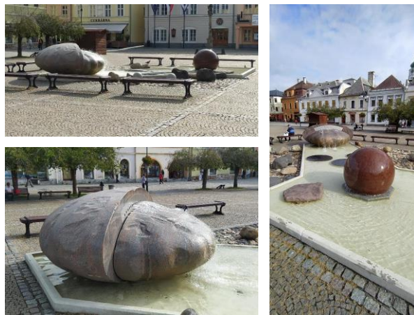
Foto: Kašna na náměstí v Bruntále